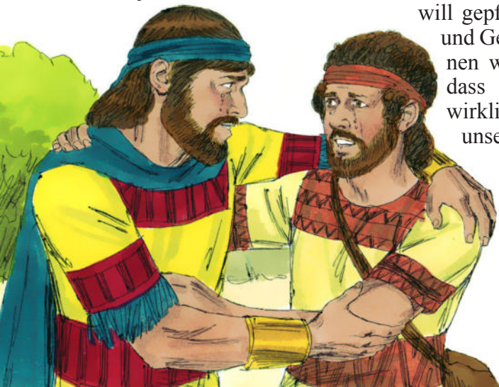
Enge Freunde: David und Jonathan