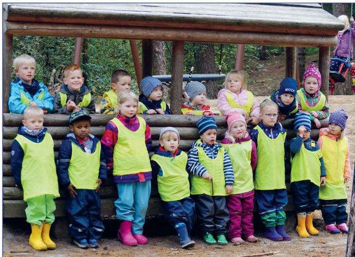
Regelmäßiger Umgang mit der Natur: Ein Gruppenwaldtag im Heseler Wald