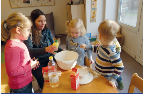
Gemeinsam stellen wir Knete her.

Stuhlkreissspiele machen Spaß: Wir spielen den „Eidechsentanz“.